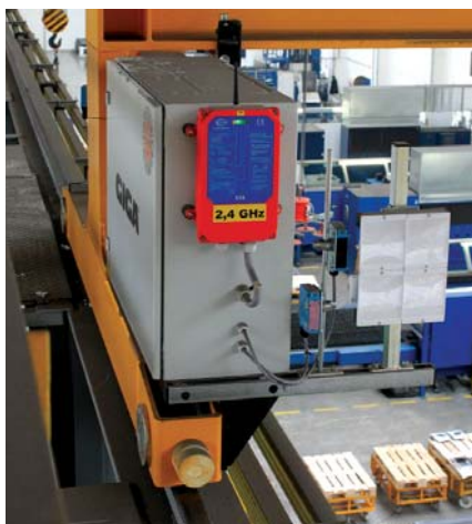
Detail pojezdu s elektrickým rozvaděčem a přijímačem RDO

signálů z tenzometrického snímače, který je standardně součástí kladkostroje GIGA. Signál se zpracovává zařízením GIGAtronic tak, že pro samotné vážení je navíc potřeba pouze zobrazovací displej, který v případě dálkového ovládání je součástí dodávky jeřábu, a tudíž vážení břemene umožňuje zařízení bez dokupování dalších drahých komponentů. Obsluha tak má okamžitý přehled o váze expedovaného nákladu.