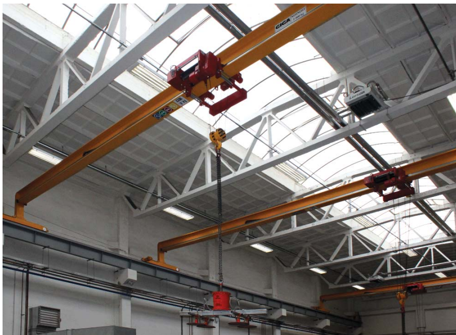
Jedna ze dvou lodí haly č. 10 pro přípravu materiálu