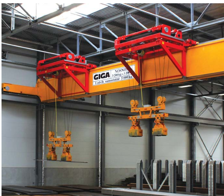
GKMJ 3,2t+3,2t/26,5m – jednosloupkový jeřáb s dvěma konzolovými kočkami s magnety v hale 7a

Největší jeřáb na vstupu odbaví denně v průměru 120 tun materiálu.